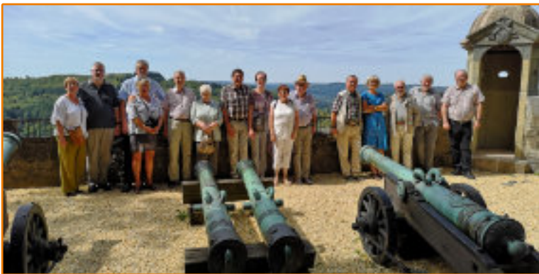
Schlossbesichtigung Braunfels im August 2018, Kanonenhof