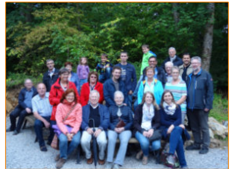
Besuch der Schauhöhle Herbstlabyrinth, Breitscheid im August 2016