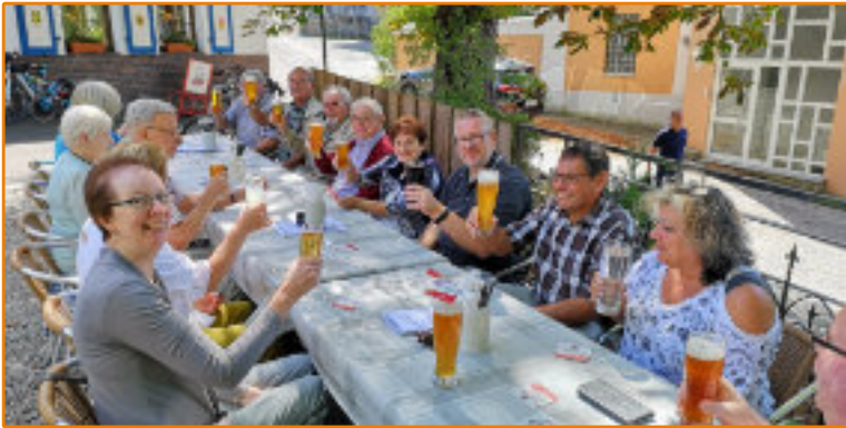
Schlossbesichtigung Braunfels im August 2018, Mittagessen in der Obermühle