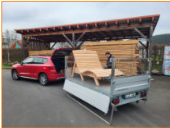
Abholung in Marburg